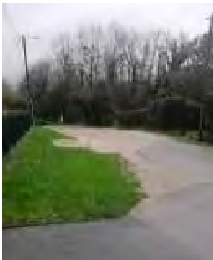
Au pont de Tournes