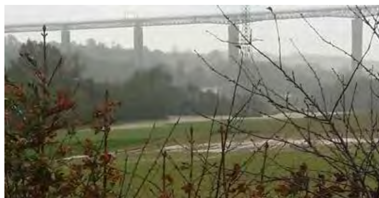
Vue depuis le cimetière

Dans cette période, Véolia a été sollicitée plusieurs fois par la commune pour déboucher des tuyaux situés dans des fossés couverts. On a fait le constat suivant dans les résidus sortis de ces hydrocurages il y avait des déchets de tailles de haies qui n'avaient pas été évacués !