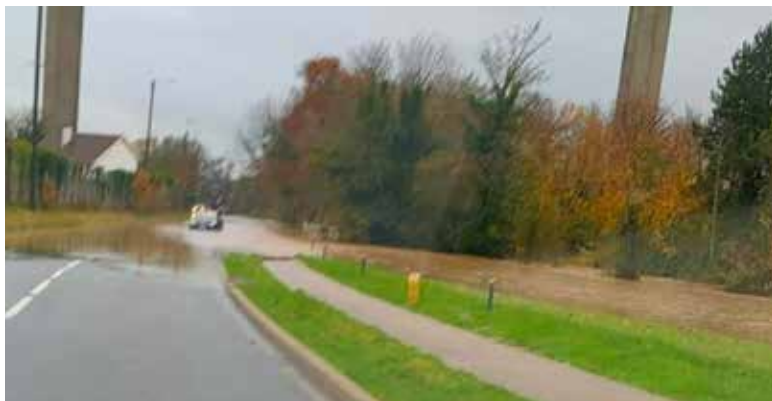
Route de Saint-Léonard