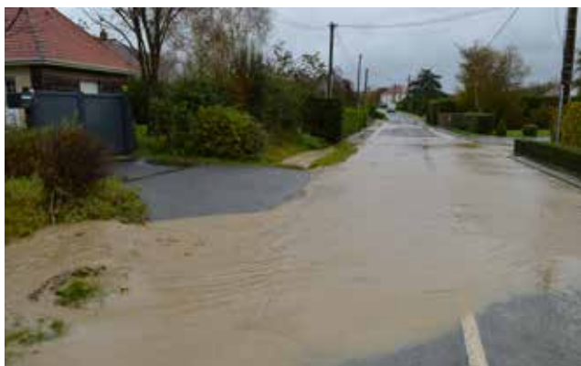
Au Hameau d'Esprès