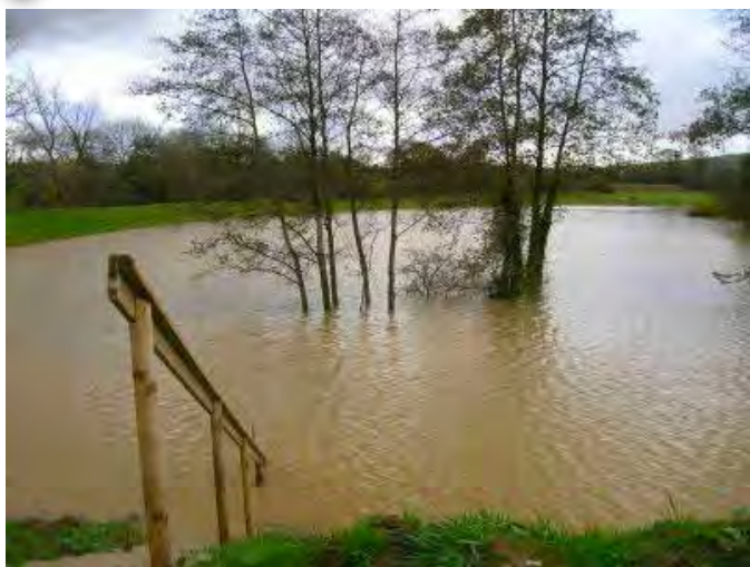
Au bassin de rétention

Des demandes de reconnaissance "catastrophes naturelles" ont été déposées par la commune. Echinghen a été retenue dans l'arrêté du 12 novembre 2023 et dans celui du 18 décembre 2023 parus au Journal Officiel n°2.