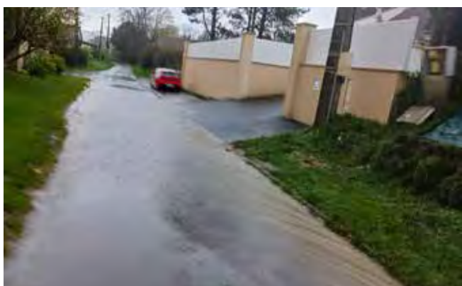
En haut de la route deournes