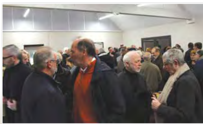
Le moment de convivialité