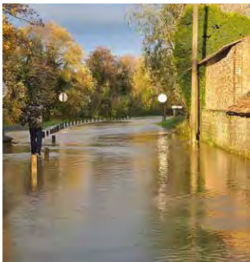
Du côté d'Emmaüs