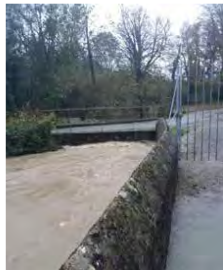
Au pont à Esprès