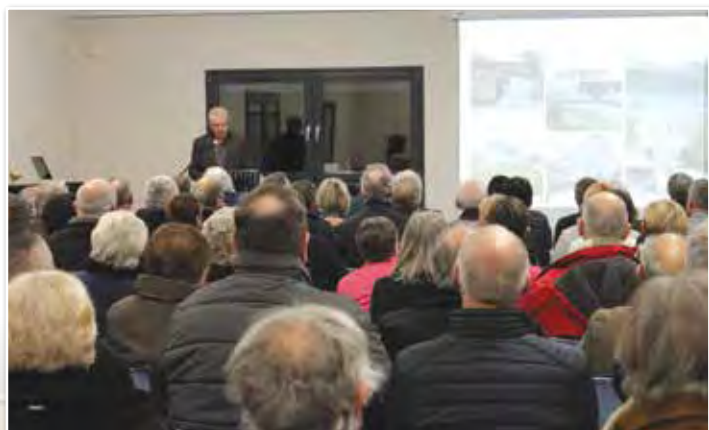
Le discours du Maire