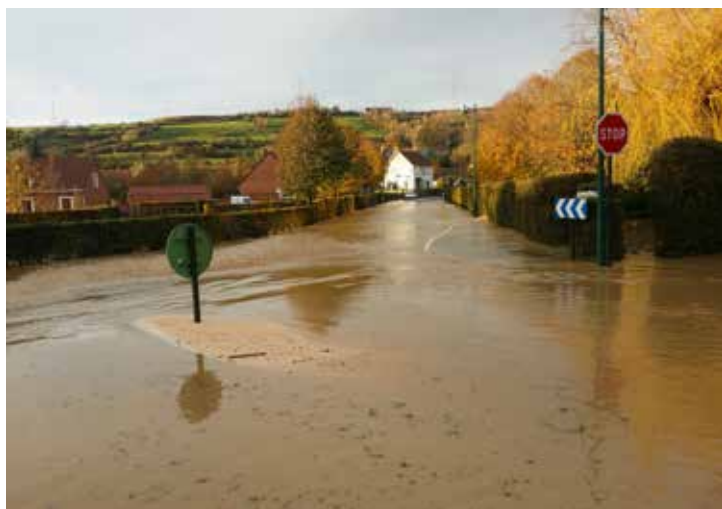
Au carrefour des tourelles